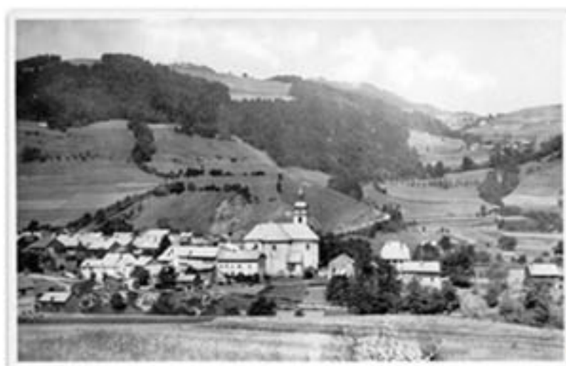
Vue du Village de Lullin

En 1890, la tribune est construite. Trois panneaux en bois sculptés (aujourd'hui à gauche et à droite des ambons et au milieu sous l'autel) représentent la vie de Saint Jean Baptiste. Huit anges sont sculptés par Pédrini d'Annecy et dorés à la feuille.