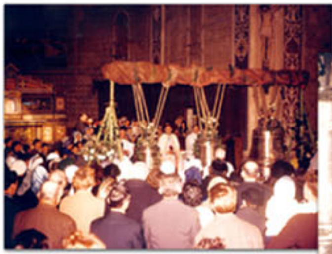
Bénédiction des Cloches en 1963

Automne 1963, bénédiction de l'église, il y a maintenant trois cloches : - Marie Baptistine - mi 6 - Marie Cécile - sol - Marie Jeanne Françoise - si 6