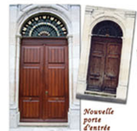
Nouvelle porte d'entrée

Rehausse de la tribune. Création d'un sas d'entrée afin de faire mieux pénétrer la lumière dans l'église.