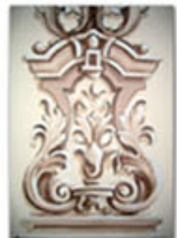
Toute la décoration des piliers, corniches et des arcs a été supprimée après l'incendie de 1963. Une décoration inspirée des motifs du début du siècle a été réalisée.