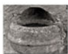
Bénitier dans le mur du cimetière

Une nouvelle église fut construite, sans doute en 1577. Elle était située à l'emplacement du cimetière actuel (on peut d'ailleurs encore y trouver le bénitier et au centre la croix). Sa toiture était couverte en bardeaux de bois, et dans le chœur se trouvait un caveau réservé à l'inhumation des recteurs de la paroisse. Dans la nef, on enterrait les paroissiens qui payaient à cet effet une certaine somme, enfin dans la chapelle du rosaire, les membres de la famille de Genève.