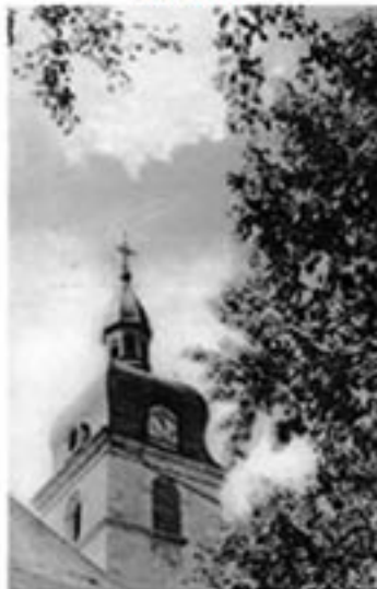
Le clocher de l'église en 1950

En janvier 1963, le clocher et la toiture brûlent, les cloches sont fondues, on refait le tout et on remet tout ce qui a pu être sauvé dans l'église (chemin de croix, statues...).