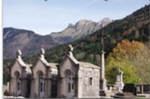
Ancien emplacement de l'Eglise

Une nouvelle église fut construite, sans doute en 1577. Elle était située à l'emplacement du cimetière actuel (on peut d'ailleurs encore y trouver le bénitier et au centre la croix). Sa toiture était couverte en bardeaux de bois, et dans le chœur se trouvait un caveau réservé à l'inhumation des recteurs de la paroisse. Dans la nef, on enterrait les paroissiens qui payaient à cet effet une certaine somme, enfin dans la chapelle du rosaire, les membres de la famille de Genève.