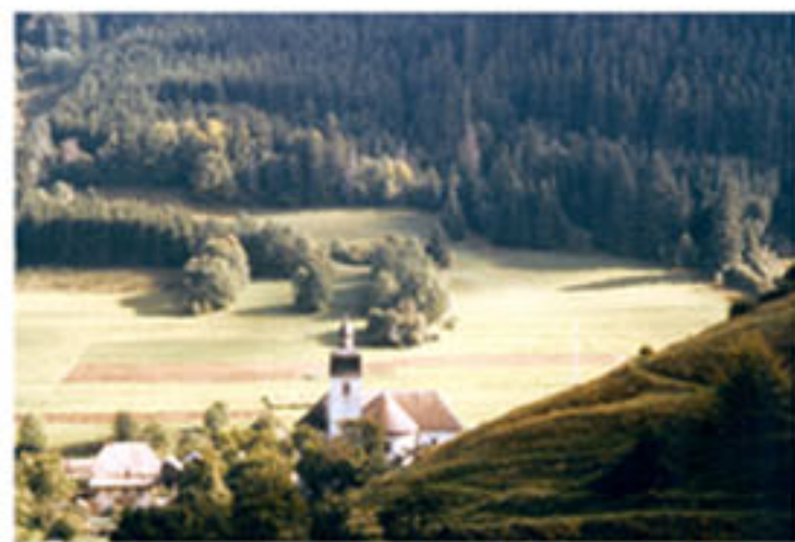
Vue de l'église en 1970

En 1964, on rentre dans l'église rénovée.