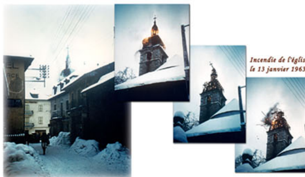
Incendie de l'église le 13 janvier 1963

En janvier 1963, le clocher et la toiture brûlent, les cloches sont fondues, on refait le tout et on remet tout ce qui a pu être sauvé dans l'église (chemin de croix, statues...).