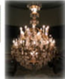
Remise en état du lustre

16 Novembre 2003 : Inauguration de l'église