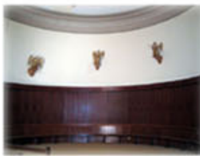
Création d'une boisserie au chœur pour constituer une ambiance plus chaleureuse